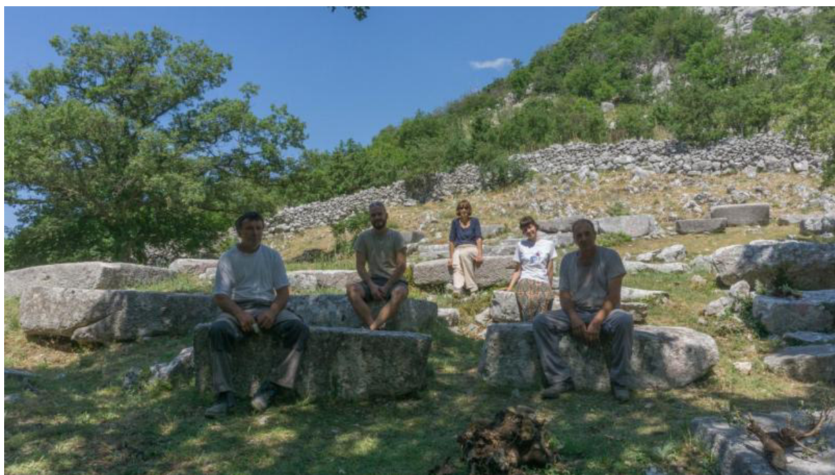
Photo: Artisans et volontaires faisant la pause après la reconstruction d'un mur de clôture entourant une église médiévale et son cimetière protégés par l'UNESCO – Konavle 2019